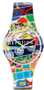
(Swatch) Club Watch 2014/2015

Sur le chemin de retour vers l'hôtel, nous ferons un petit bout de croisière à bord d'une unité des bateaux Mouettes ( www.mouettesgenevoises.ch ).