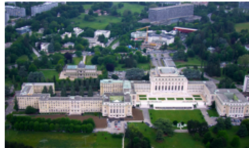
Palais des Nations