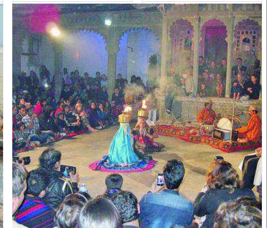
Spéciale de danses indiennes.