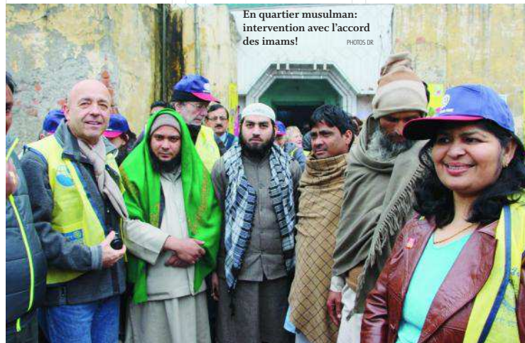
En quartier musulman: intervention avec l'accord des imams!

— Le Rotary a été historiquement le premier «club service» créé au monde. L'association, dont le siège se trouve à Evanston aux Etats-