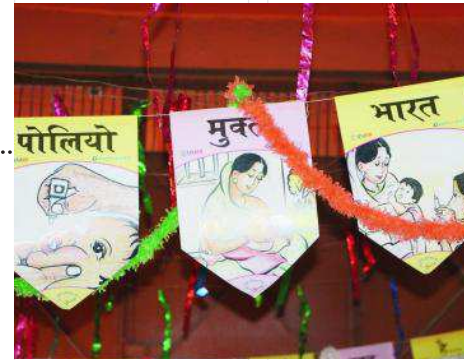
Matériel didactique explicatif.

Unis, se présente comme une organisation apolitique et ouverte qui encourage une haute éthique civique et professionnelle.