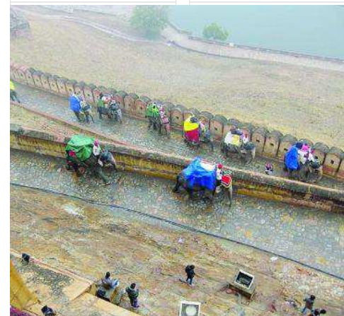
Une balade à dos d'éléphant pour les Rotariens.

Au terme de l'entretien, Gérard Beuchat dresse un bilan extrêmement positif de ce voyage permettant de «découvrir les collègues sous un autre angle. Tout s'est bien passé et les liens vont s'en trouver renforcés. Pourquoi ne pas organiser dès lors ultérieurement une autre action dans un domaine différent?» s'interroge-t-il. ■